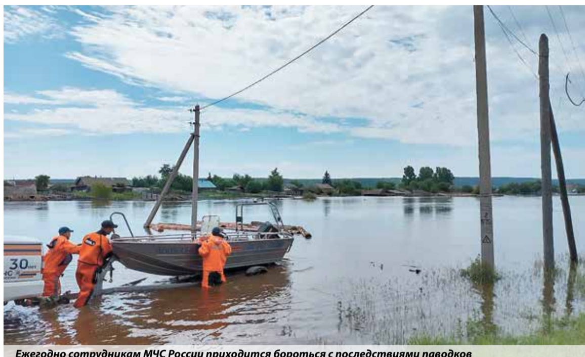
Ежегодно сотрудникам МЧС России приходится бороться с последствиями паводков

К нарушителям применяются меры административного воздействия, вплоть до приостановки. Так, в этом году по решению судов приостанавливалась эксплуатация девяти