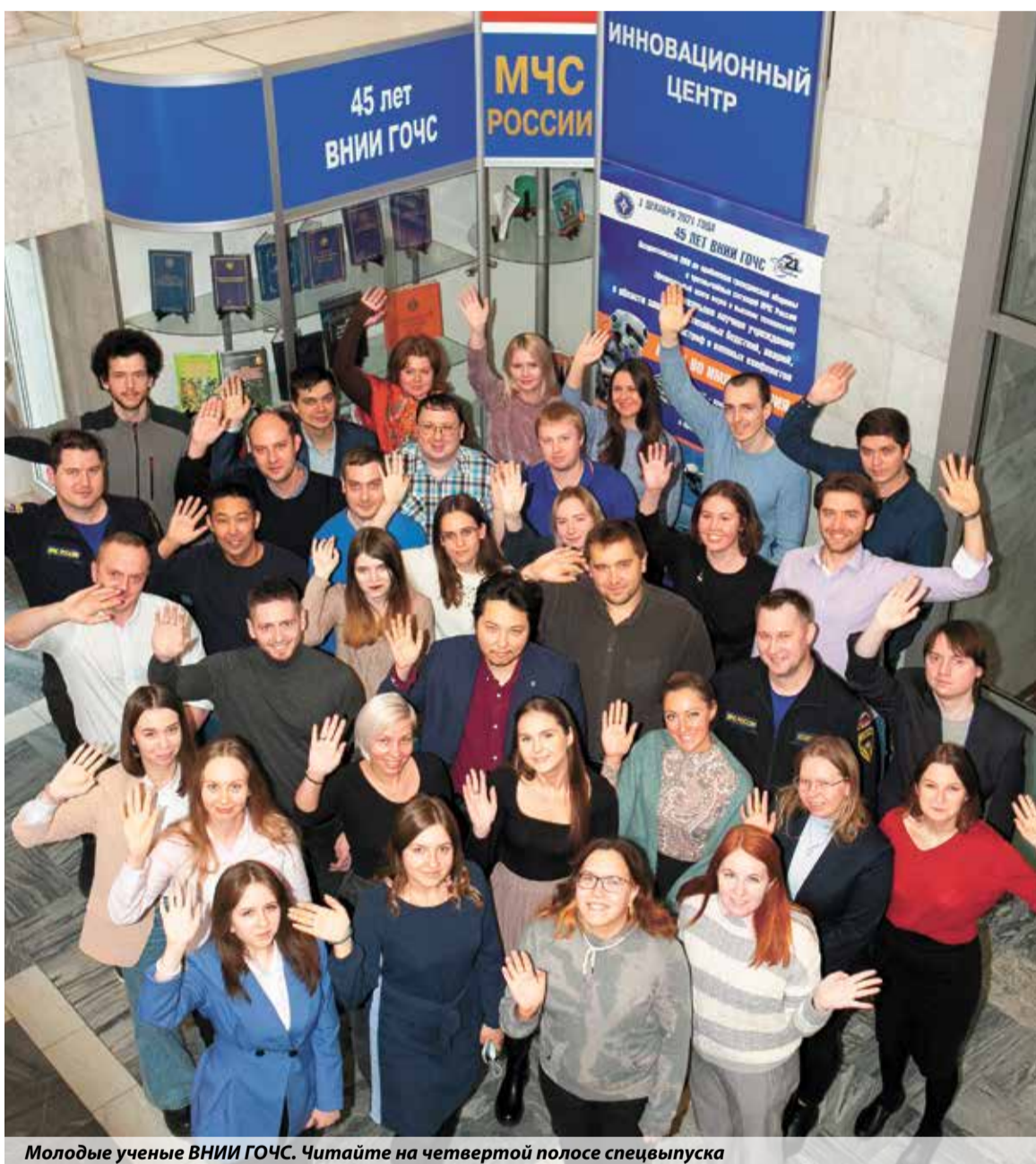
Молодые ученые ВНИИ ГОЧС. Читайте на четвертой полосе спецвыпуска