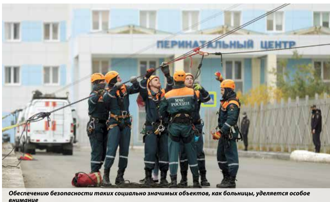
Обеспечению безопасности таких социально значимых объектов, как больницы, уделяется особое внимание

объектов здравоохранения и отдельных помещений. Кроме того, с начала года к административной ответственности привлечено более двух тысяч юридических и около трех тысяч должностных лиц. Еще около 1,5 тысячи дел об адми-