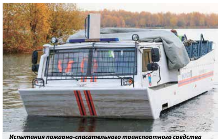
Испытания пожарно-спасательного транспортного средства

✓ 30 национальных стандартов разработаны институтом за последние пять лет по требованиям к аварийно-спасательному инструменту и спасательным технологиям.