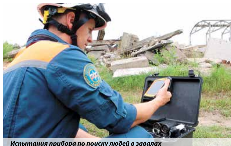
Испытания прибора по поиску людей в завалах